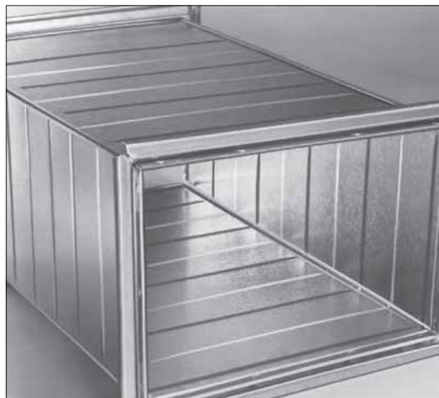
Kanal med LS-flangeprofil

LS-2 tætningslisten skal skiftes, når kanaler demonteres, ellers bliver samlingerne ikke tætte.